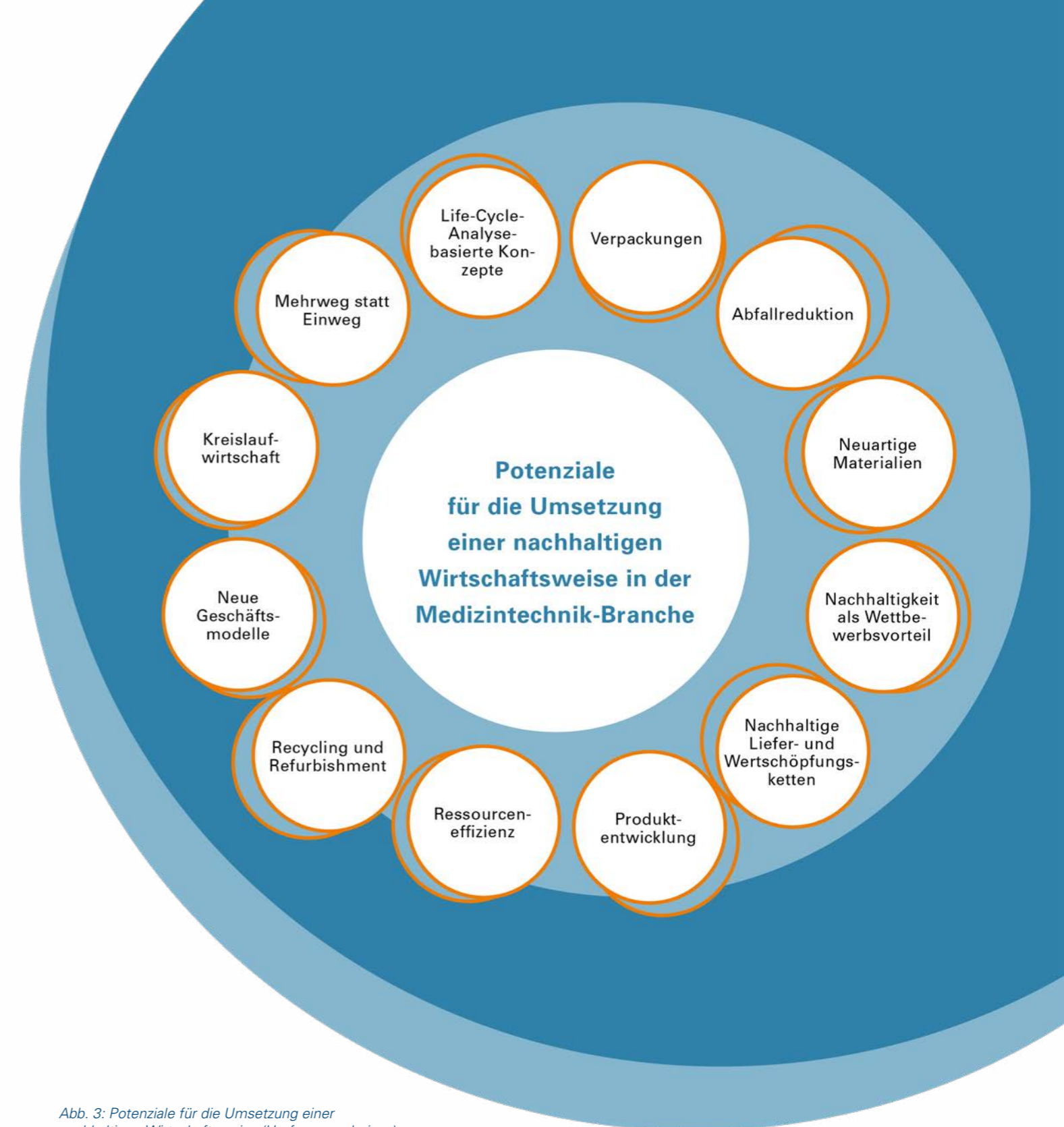
Abb. 3: Potenziale für die Umsetzung einer nachhaltigen Wirtschaftsweise (Umfrageergebnisse)

Für die befragten Unternehmen spielt Nachhaltigkeit vor allem in der Produktentwicklung, in Herstellungs- und technologischen Prozessen sowie in der Unternehmenskultur eine Rolle. Aber auch die Bereiche Verpackung sowie die Lieferkette und Logistik sind hier relevant. Den Herausforderungen – wie den regulatorischen Anforderungen sowie der Umsetzung nachhaltiger Prinzipien entlang der gesamten Liefer- und Wertschöpfungskette – steht ein gewaltiges Potenzial gegenüber: Abbildung 3 zeigt, in welchen Bereichen Potenziale für die Umsetzung einer nachhaltigen Wirtschaftsweise gesehen werden.