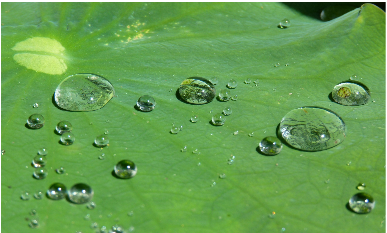
Der Lotuseffekt ist ein Beispiel für die bioinspirierte Wertschöpfung.

Eine Strategie für die Umsetzung der Biointelligenz zeigt die Broschüre „Potenzialanalyse und Roadmapping Biointelligenz für Baden-Württemberg“, 4) die unter Federführung der BIOPRO Baden-Württemberg in Zusammenarbeit mit dem Fraunhofer-Institut für System- und Innovationsforschung ISI in Karlsruhe erstellt wurde. Denn für die Umsetzung der Innovationen ist auch eine Anbindung an den starken Wirtschaftsstandort Baden-Württemberg und seine Unternehmenslandschaft von großer